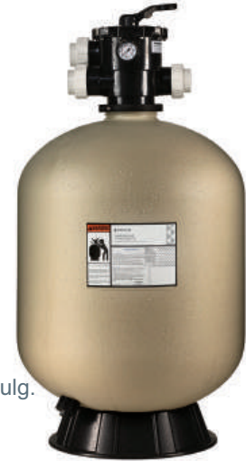
Filtro de montaje superior Sand Dollar

* Temperatura máxima del agua para Sand Dollar 95° F